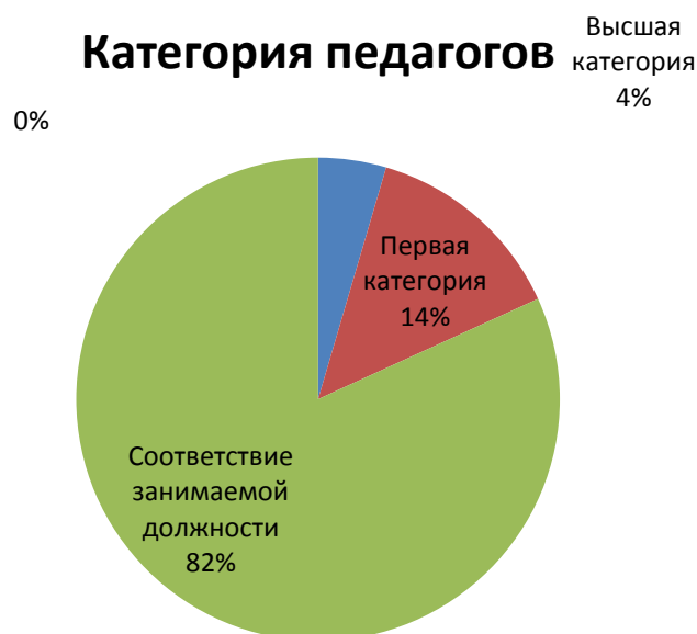
Диаграмма с характеристиками кадрового состава Детского сада.

В 2020 году 1 педагог проходит обучение в колледже АНПОО "Многопрофильная Академия непрерывного образования", является студентом второго курса, 2 помощника воспитателя проходят обучение в колледже АНПОО "Многопрофильная Академия непрерывного образования, являются студентами 1 курса. В течение 2020 года педагогами Детского сада уровень педагогической компетенции повышался посредством различных форм организации неформального образования, а именно: посещение открытых просмотров НОД, консультаций для педагогов по распространению личного опыта, семинаров-практикумов, организованных педагогом-психологом и старшим воспитателем, методистом Детского сада, а так же педагогических советов. Педагоги детского сада участвуют в постоянно действующем семинаре «Духовно-нравственное воспитание в контексте ФГОС», проекте для молодых педагогов «Педагогический дебют», менторских площадках БОУ ДПО г. Омска "Центр творческого развития и гуманитарного образования "Перспектива".